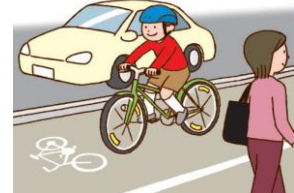
自転車道、自転車横断帯がある場合は必ず指定された部分を走行しましょう。