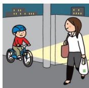
側面に反射材をつけましょう！